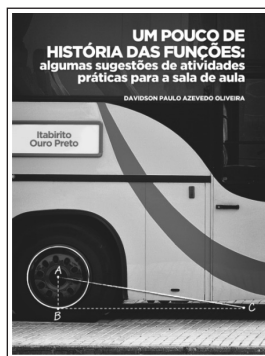
Figura 1 – Capa do Caderno de Sugestões para os Professores

A capa do produto educacional foi elaborada de maneira a apresentar duas atividades propostas em sala de aula, a primeira relacionada com o transporte escolar e a segunda com o cálculo do comprimento da circunferência e da área de um determinado círculo. A figura 1 mostra a capa do Produto Educacional.