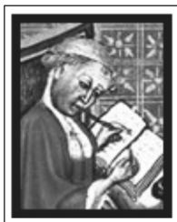
Figura 2 – Ilustração de Oresme

É importante ressaltar que, nesse tópico, houve a apresentação de um breve histórico de Nicole Oresme (1323-1382), que foi um dos gênios intelectuais do século XIV e um personagem importante para a realização desse estudo. A figura 2 apresenta uma ilustração de Oresme.