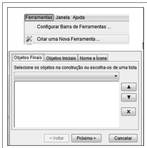
Figura 2 - Caminho necessário para criar uma nova ferramenta no GeoGebra

denominada macro e, para isso, deveriam selecionar a opção Criar uma nova Ferramenta, como ilustrado na Figura 2.