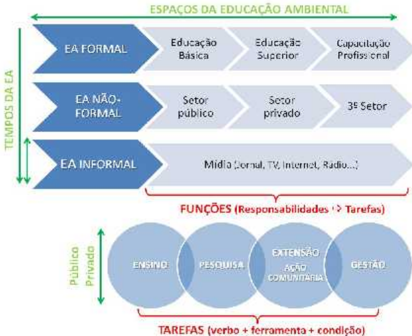
Figura 1. Contexto de ação dos educadores ambientais e os espaços e tempos de atuação profissional.

Esse conjunto de atores e ações, sintetizado na Figura 1 em função das categorias EA formal, EA não formal e informal, constitui o amplo contexto de ação do educador ambiental e demonstra o desafio da formação de profissionais em EA que estejam capacitados para atuar com os diferentes públicos (tempos) e realidades socioambientais (espaços) (SCHMIDT, 2010).